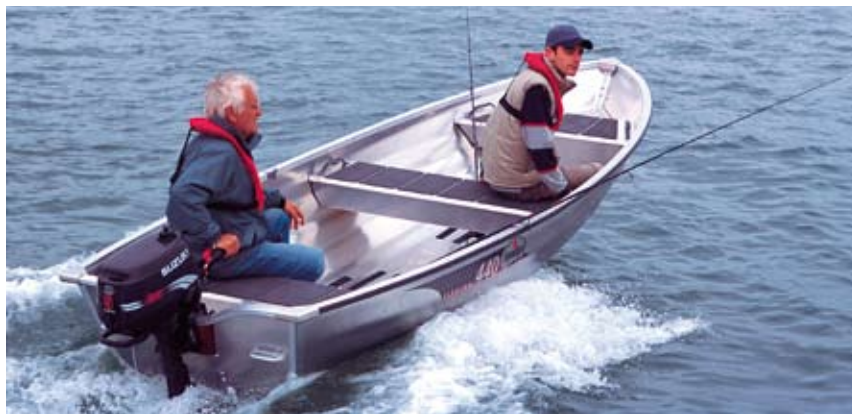
440 Fishing är Linders bästsäljare och en populär fritidsbåt i Sverige och övriga Norden.

Skicka mail till pernilla.lundgren@sundolitt.com för att anmäla dig för SundolittPressen som e-brev.